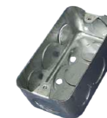
321014 Caja Registro y portaelementos 3/4" - 101mm x 50.5mm x 47mm