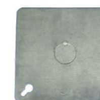
321018 Tapa caja registro 101mm x101mm