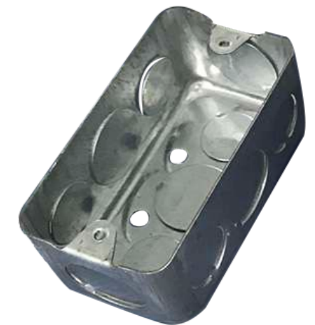
321014 - Caja Registro 3/4" 101MM x 50.5mm x 47mm