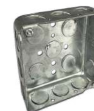
321013 Caja Registro 3/4" - 1" 101mm x101mm x 54mm