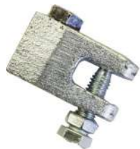
324000 Abrazadera para varilla montaje 3/8 Erico