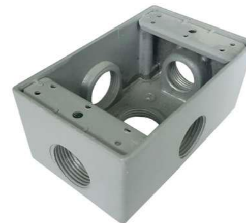
321019 - Caja porta plaqueta 3/4" 114mm x 70mm x 50mm