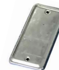
321016 Tapa caja de registro 101mm x 50.5mm