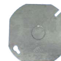
321017 Tapa caja registro redonda 101mm