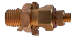
310043 - Puente seccionador