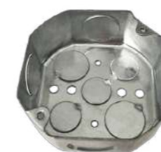
321012 Caja Registro redonda 3/4" 101mm 47mm